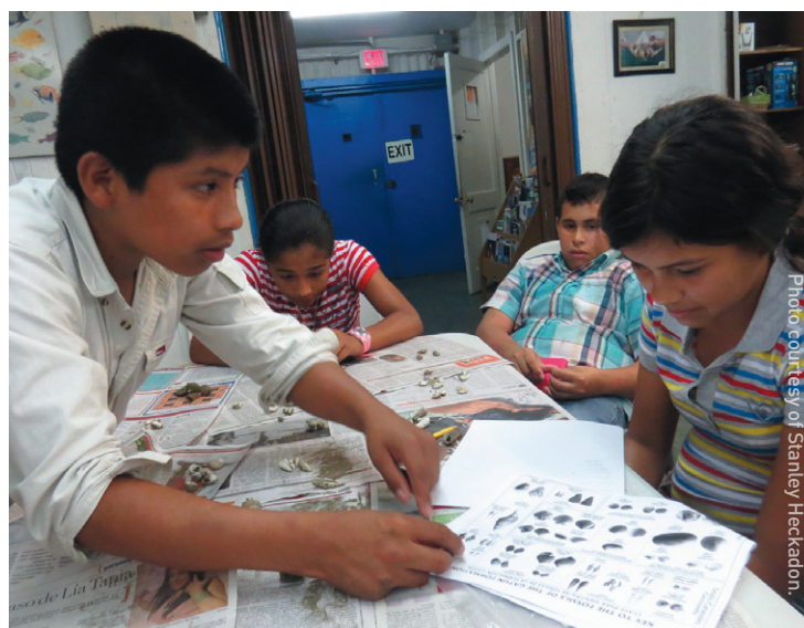
▲ Children learned to classify the fossils they collected during a field trip to the Gatun Formation.

Del 13 al 17 de diciembre, 21 estudiantes, tres profesores y dos madres de familia de la remota comunidad de La Cuchilla, corregimiento El Bongo, distrito de Bugaba, Chiriquí, participaron en el primer Campamento de Ciencia Martin Berger en Punta Galeta. Ninguno de los niños había visto el mar antes de llegar a la estación Smithsonian en la costa caribeña.