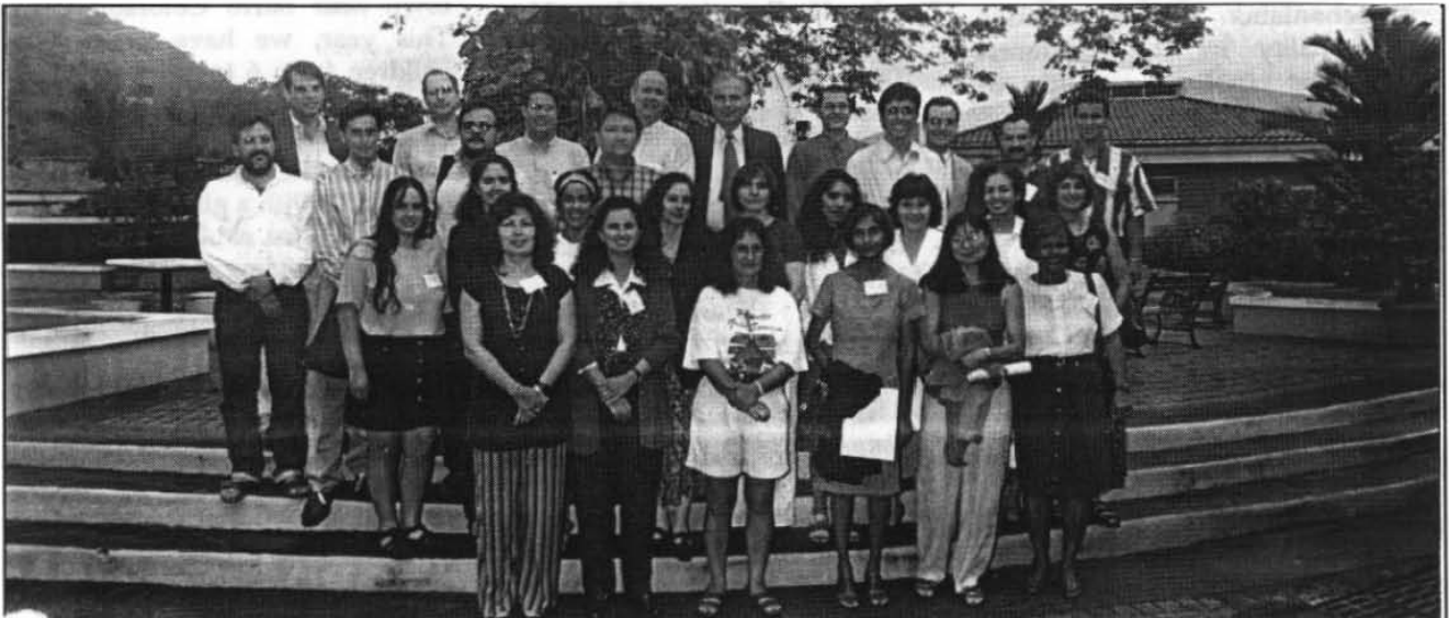
Group photo of the participants of the Environmental Economic Workshop organized by the Latin American Scholarship Program for American Universities, LASPAU, and sponsored by STRI, Fulbright and Ford Foundation, held in Panama from October 15-18 ••• Foto de grupo de los participantes del Taller Económico del Ambiente, organizado por el Programa de Becas de Latinoamérica para Universidades Americanas, LASPAU, y auspiciado por STRI, Fulbright y la Fundación Ford, llevado a cabo en Panamá, del 15 al 18 de octubre en el Centro Tupper.