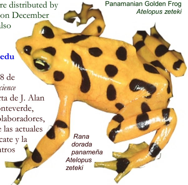
Rana dorada panameña Atelopus zeteki

último grupo, todos signatarios del Plan de Acción para la Conservación de Anfibios (ACAP) que "refleja la necesidad de una respuesta comprensiva global ante las extinciones de anfibios..." defienden la posición de las medidas de rescate, ya que, de acuerdo a ellos, "trabajar tanto con las causas más próximas al igual que con las últimas, es la mejor estrategia."