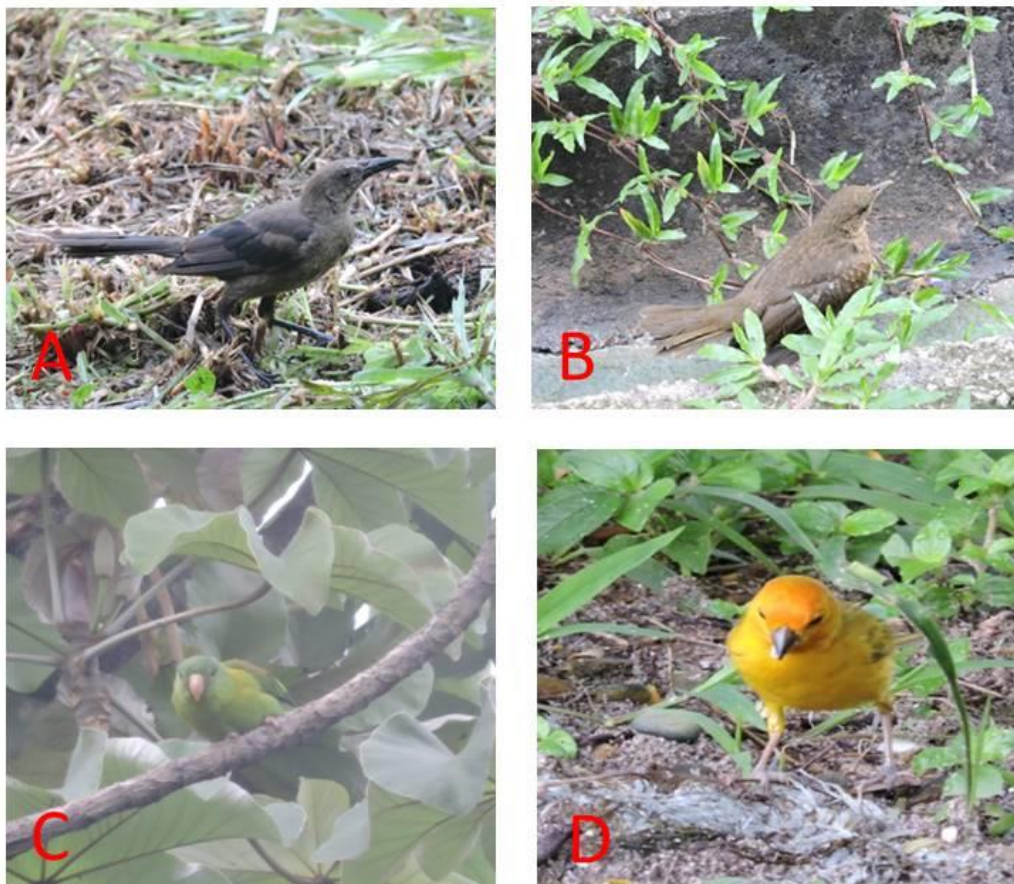
Figura 1. Aves en Centro Regional Universitario de Colón: A) Quiscalus mexicanus (Talingo) B) Turdus grayi (Mirlo Pardo) C) Brotogeris jugularis (Periquito Barbinaranja) D) Sicalis flaveola (Pinzón Azafranado).

Las especies más abundantes fueron: Quiscalus mexicanus , Thraupis episcopus , Brotogeris jugularis ; seguido de Turdus grayi , Myiozetetes similis , Sicalis flaveola (Figura 1 A-D). Mientras que las menos abundantes o escasas fueron Melanerpes rubricapillus , Leptotila verreauxi y Pitangus sulphuratus . En tanto que Todirostrum cinereum , Spinus psaltria y Sporophila funerea fueron raras de observar.