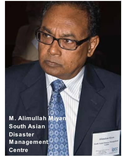
M. Alimullah Miyan South Asian Disaster Management Centre

Bosque Tropical en el Parque Natural Metropolitano y la Isla Barro Colorado. Además recibieron información sobre la red mundial de parcelas de dinámica de bosque del Centro de Ciencias Forestales del