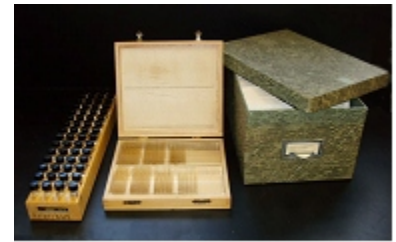
Example of the collection

La colección es parte de un laboratorio de palinología establecido en la Universidad de Texas en 1954, y que se expandió a través de preparaciones originales e intercambios con otros laboratorios alrededor del mundo. Comprende 25,000 diapositivas de polen con taxa