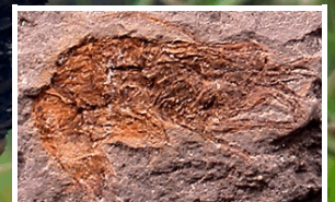
Turonian shrimp from Colombia