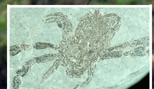
Costacopluma: Paleocene Costacoplumid crab from Colombia