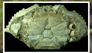
Miocene Portunid crab from Panama