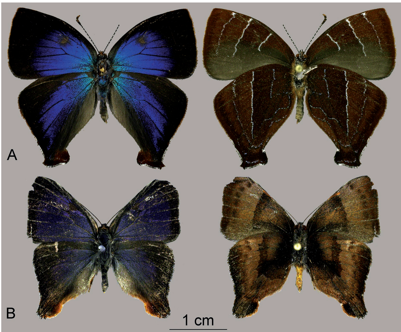
Figura 3. Lycaenidae (machos) en el valle del río Cosñipata en vista dorsal (izquierda) y ventral. A. Micandra dignota (Draudt, 1919). B. Penaincisalia purpurea (K. Johnson, 1992). Escala 1 cm.

Las únicas otras especies cuya crianza ha sido reportada en la literatura en estos dos géneros son Penaincisalia aurulenta K. Johnson, 1990 sobre Vaccinium sp. (Ericaceae) en Perú (Beccaloni et al. 2008), P. loxurina (C. Felder & R. Felder, 1865) y Micandra sylvana (Jørgensen, 1934) sobre Eupatorium bupleurifolium (Compositae) en Argentina (Hayward 1943, 1960, 1969).