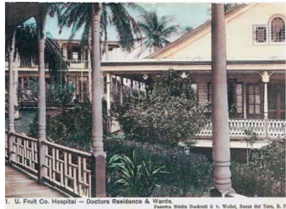
1. U. Fruit Co. Hospital - Doctors Residence & Wards. Panama Studio Dockrell & v. Wedel, Bocas del Toro, B. F.

En el próximo número de Epocas veremos otras experiencias de von Wedel, como fotógrafo de la naturaleza y coleccionista en Bocas del Toro y San Blas.