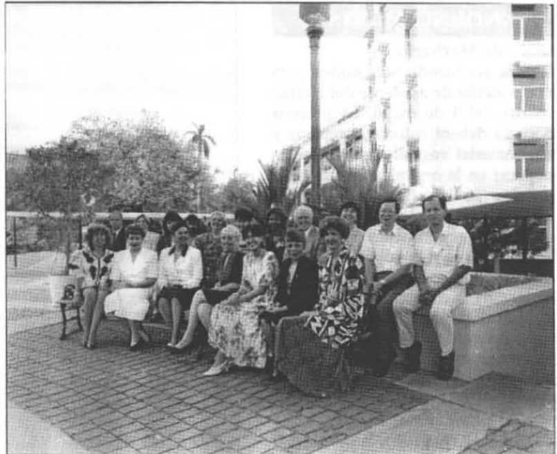
On Wed, Apr 26, Interamerican Secretaries' Day, STRI secretaries and their supervisors gathered around Corotu Plaza for a group photo ••• El miércoles 26 de abril, Día Interamericano de las Secretarias, las secretarias de STRI y sus supervisores se reunieron en la Plaza Corotú para la tradicional foto de grupo.