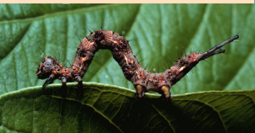
Selenisa suerooides (Noctuidae) by Annette Aiello

Los primates de Panamá y su función en el bosque tropical por Pedro Méndez, miércoles 11 de abril, 6pm.