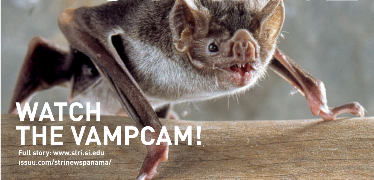
Common Vampire Bat, Desmodus rotundus , running on the ground.