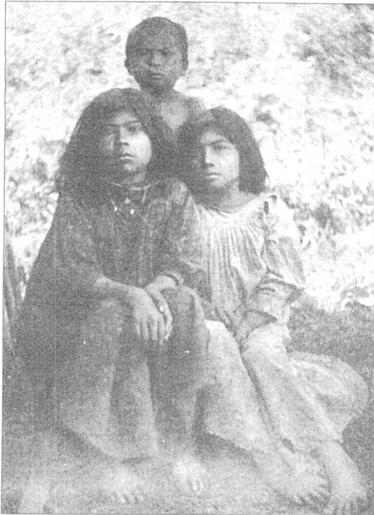
"A menudo las niñas guaymies tienen caras dulces y ojos bellos". Foto: H. Pittier, Chiriquí 1911-12.

"Estos habitantes del bosque son de una disposición más sumisa y silenciosa; su contacto diario con la secreta y escondida vida animal de las selvas los ha hecho más astutos y desconfiados que sus hermanos de las sabanas. Estos, viviendo en medio de estas agrestes montañas, en un clima relativamente frío, y disfrutando día a día el magnífico panorama de las montañas vecinas y las planicies, enmarcadas en nubes grises y aguas azules, son más energéticos, abiertos y también más orgullosos de su indiscutible independencia." □