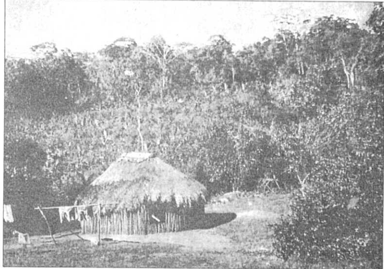
Vivienda circular guaymí, en un claro de las selvas bajas del oriente de Chiriquí, rodeada de cultivos de plátano, yuca y otoo.

"En ciertas comunidades la riqueza de la gente se calcula según el número de ganado. Entre los Guaymies el número de esposas es la medida. El rol de éstas en la economía doméstica no es, sin embargo, simplemente la de un juguete, como en ciertas naciones orientales. Ellas constituyen el capital de trabajo de la familia, y su forma de cortejar la preferencia de su amo no es a través del amor, sino del sudor. Aun cuando, y aunque sean un poco más que simples bestias de carga, aparentan estar bastante satisfechas con su suerte, y tendría que pasar mucho tiempo antes de que sientan la necesidad de unirse el genio de las modernas aspirantes a la igualdad entre los sexos."