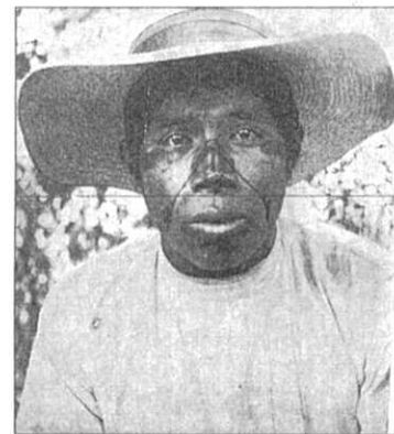
Decoración facial de un hombre guaymie mostrando la V invertida.

"Los hombres hacen igual, y, además, al salir de cacería, invariablemente abandonan sus pantalones antes de empezar a correr tras algún animal salvaje. Esta prác-